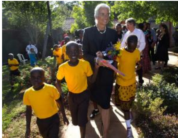
Christine Lagarde, Directora-Geral do Fundo Monetário Internacional, caminha cercada de crianças após a visita a Nest Home, um orfanato e casa de reinserção para crianças, em 7 de Janeiro de 2014, em Nairobi, Quênia. Lagarde visitará dois países em sua viagem à África.

Pelo terceiro ano consecutivo, mantive a minha tradição de marcar o Ano Novo com uma visita à África Subsariana — uma região que verdadeiramente encerra um enorme potencial! Enquanto a economia mundial mantinha a sua atenção virada para a crise nas economias avançadas, África prosseguia na sua marcha silenciosa de crescimento robusto, liderado por um sector privado dinâmico e pelo forte aumento do investimento estrangeiro. Ao longo da última década, a África Subsariana cresceu a uma média de 5,6% ao ano. Os países da África Oriental estão entre os que mais se destacaram. Assim, nada mais apropriado do que iniciar as minhas viagens este ano com uma visita ao Quênia, que emergiu como uma das “economias de fronteira” da região — países cujo desempenho recente está a fazer com que avancem para a categoria de rendimento médio.