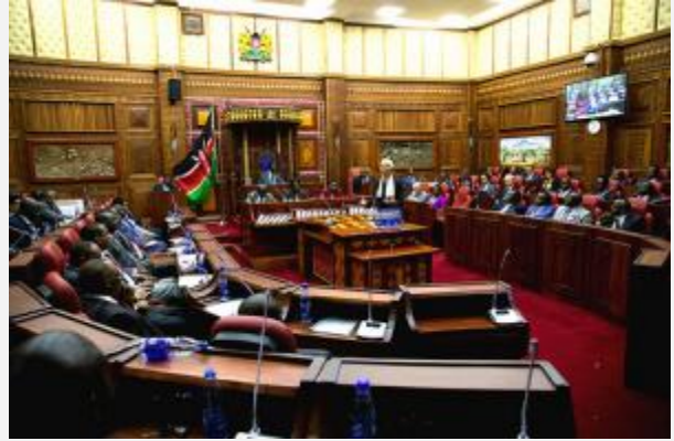
Christine Lagarde, Directora-Geral do Fundo Monetário Internacional, dirige-se à câmara de parlamentares em 7 de Janeiro de 2014, em Nairobi, Quênia. Lagarde visitará dois países em sua viagem à África.

Nas reuniões com os líderes do Quênia, como o Presidente Uhuru Kenyatta; o empresariado, os parlamentares, mulheres em posições de destaque e representantes da sociedade civil, impressionou-me o profundo compromisso de todos com políticas tendentes a assegurar que as conquistas recentes do país lancem as bases para o sucesso no futuro.