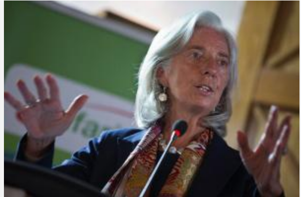
Christine Lagarde, Directora-Geral do Fundo Monetário Internacional, dirige-se à Aliança Queniana do Sector Privado (KEPSA) no evento “Mindspeak”, um fórum para jovens empreendedores, em 6 de Janeiro de 2014, em Nairobi, Quênia. Lagarde visitará dois países em sua viagem à África.

No meu encontro com alguns jovens empreendedores do Quênia, em Nairobi, discutimos as chaves para consolidar o impulso de crescimento do país e aquilo que eu denominei os “Três Cs” essenciais.